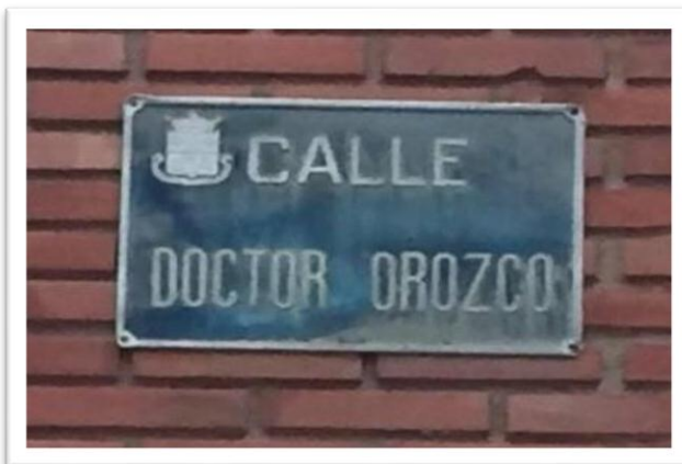
del 17 de Enero de 2017.