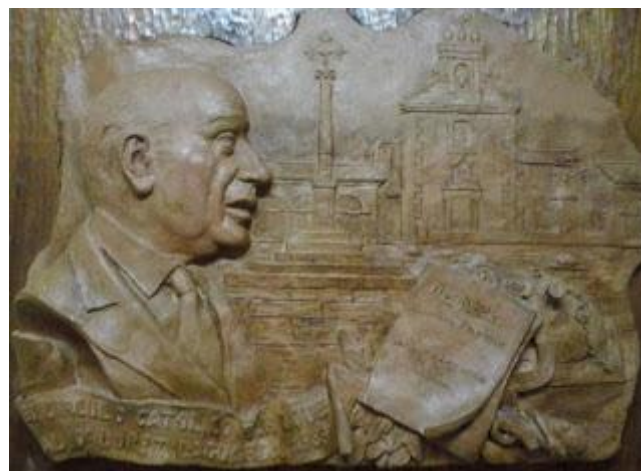
Relieve de Miguel Ten