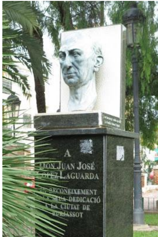
Plaza de San Roque