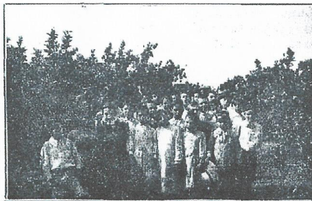
Los niños recorriendo los naranjales.

los niños corrian confundiendo sus voces con el cantar del agua en las acequias y creando ese momento raro en que parece, en