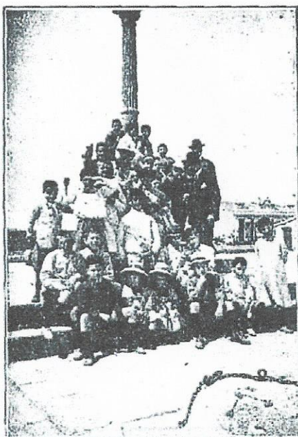
Los niños al pie de la cruz de los Silos de Burjassot.

Nuestra excursión ha terminado con el almuerzo, reparo y descanso obligados de una mañana de vivas emociones y útiles