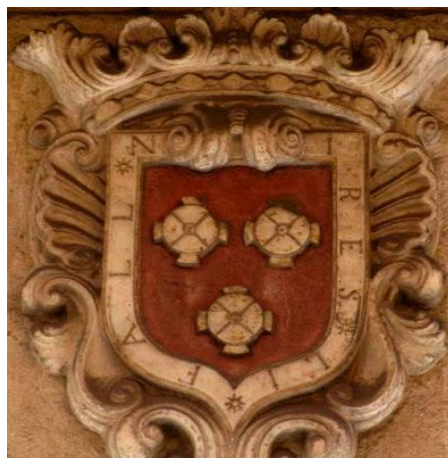
Escudo de los Mercader en el palacio de la calle Caballers, en Valencia.