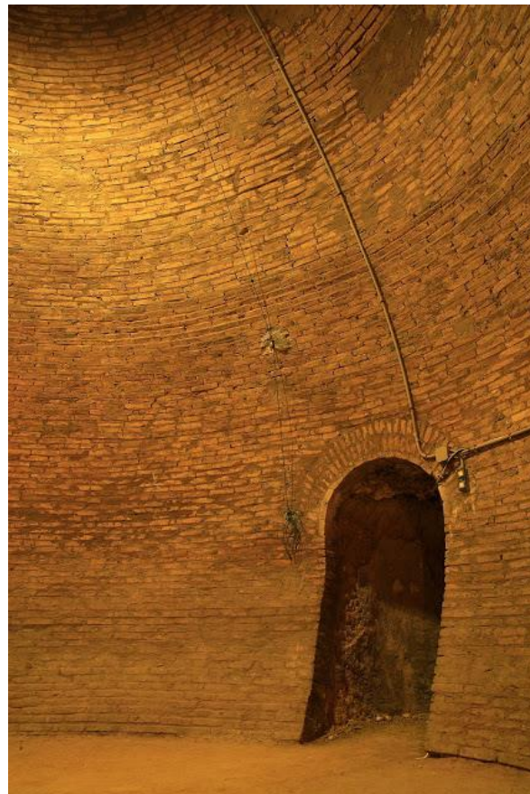
Interior de los Silos.