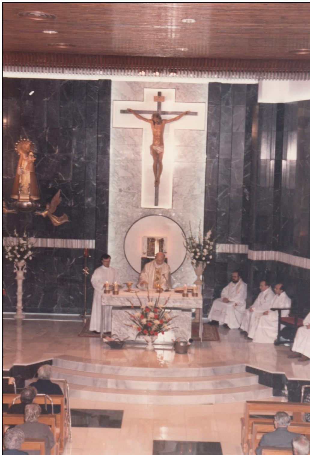
Iglesia reformada