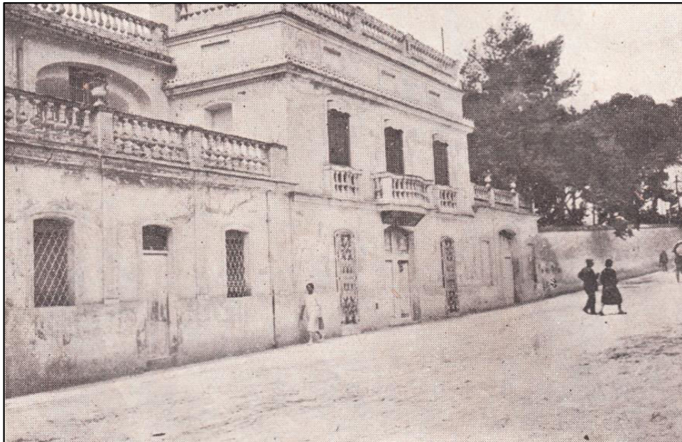
Primitivo Asilo Sequera Programa Fiestas 1927