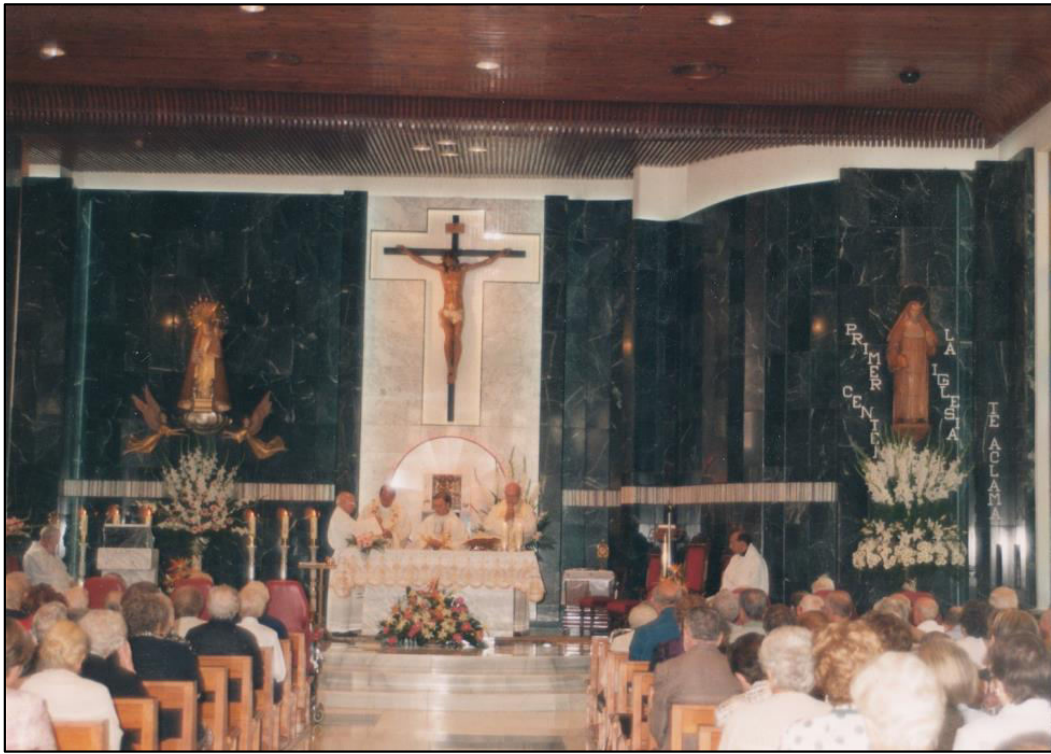
Celebración centenario fallecimiento de nuestra Santa Madre 1996-1997.