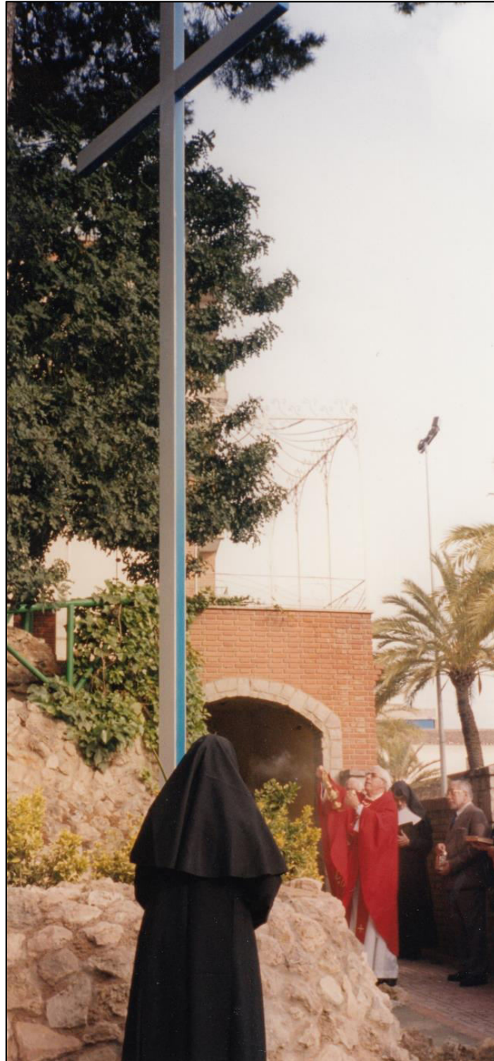
Bendición de la Cruz de la Pinada 3 Mayo 2000. Archivo Asilo Sequera