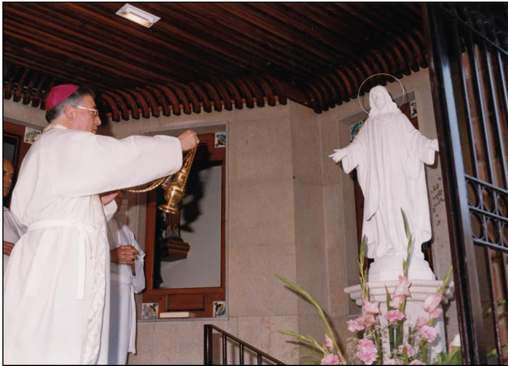
Bendición del pergamino de piedra e imagen del Sagrado Corazón 30 Junio 2000.