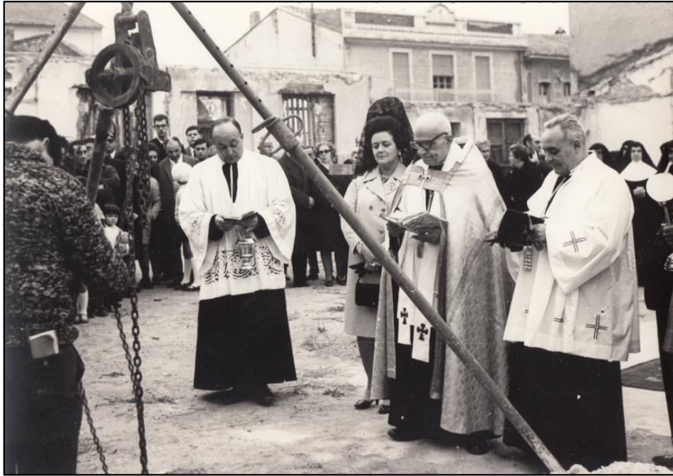
Bendición y colocación de la primera piedra de la Capilla 23 Enero 1969.