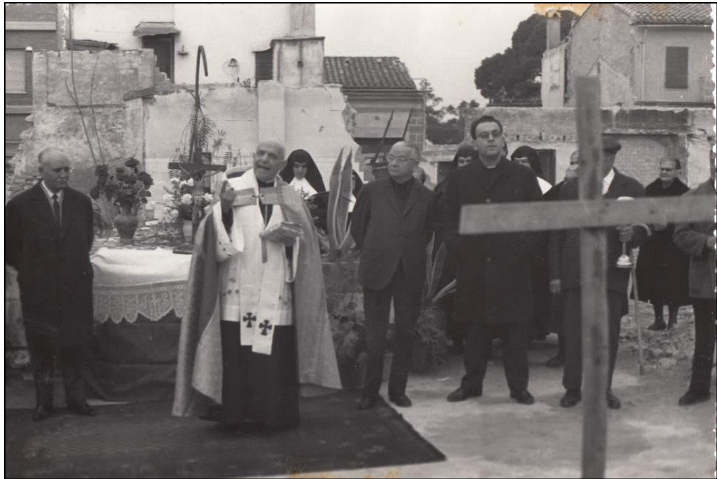
Bendición de las campanas de la nueva Iglesia