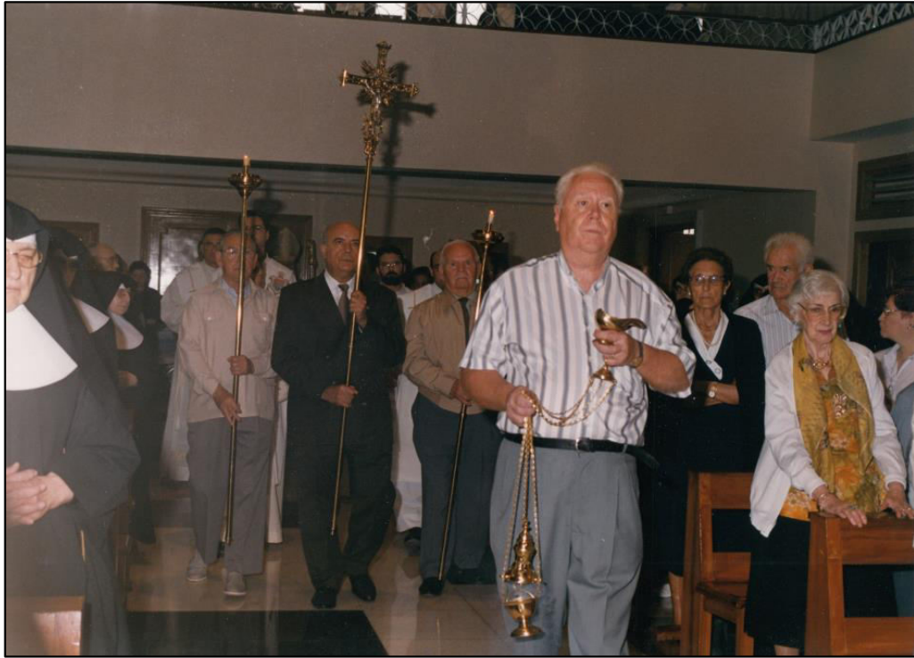
Bodas de Plata de la Provincia del Sagrado Corazón 30 Junio 2000.