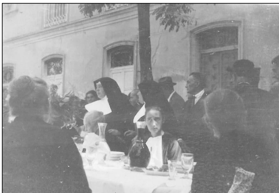
Comida benéfica en el Asilo. 12 octubre 1926