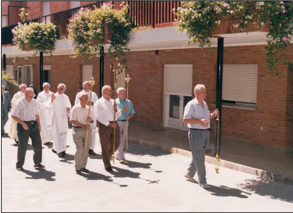
Procesión y bendición imagen de S.José 26 Julio 2000.