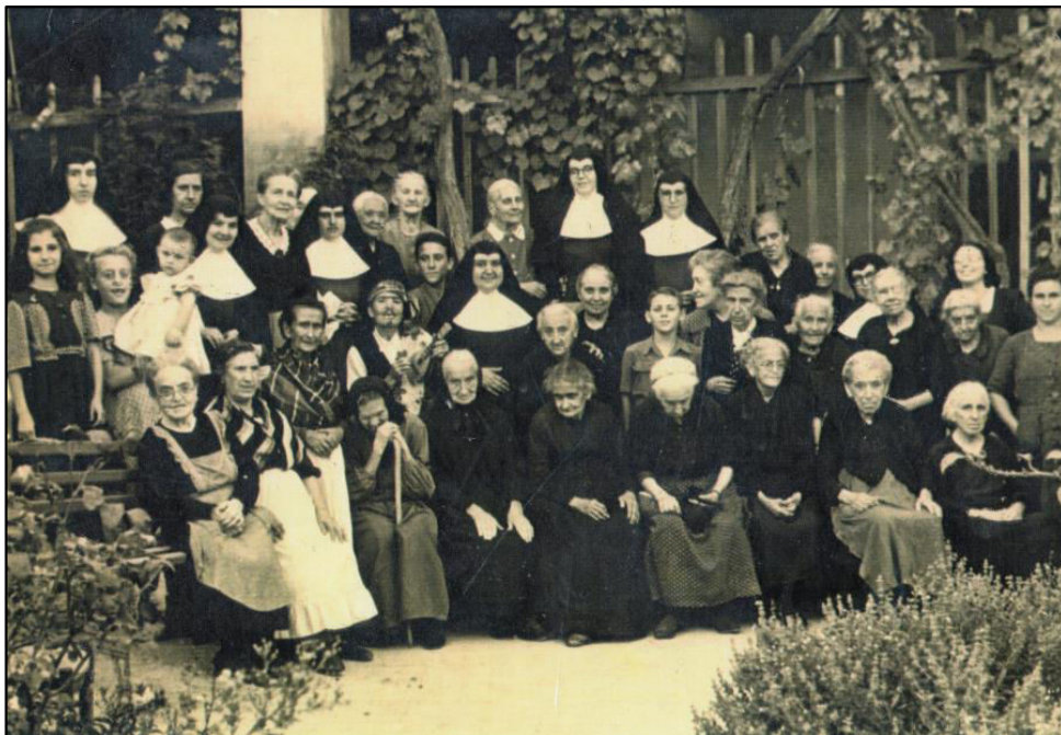
Primeras Hermanitas y asilados