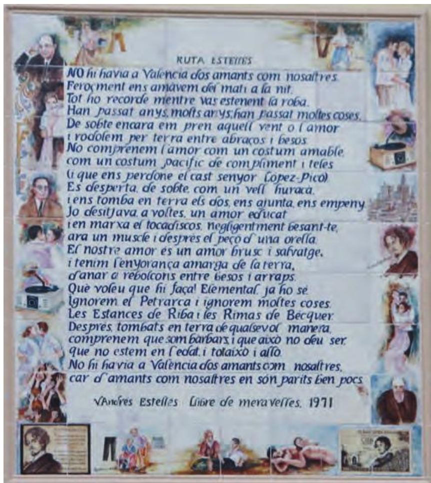
Mural cerámico de la Ruta Vicent Andrés Estellés (Burjassot)

Banco de Comercio. Mural cerámico (Valencia) Casa de la Caridad (Valencia) Escuela de Cerámica de Manises (Valencia) Casa de Cultura de Burjassot (Valencia) Ayuntamiento de Bétera (Valencia) Ayuntamiento de L'Elia (Valencia) Ayuntamiento de Alfara del Patriarca (Valencia) Ayuntamiento de Burjassot (Valencia). Murales rotulación diversas calles Ayuntamiento de Burjassot (Valencia). 12 murales ruta Vicent Andrés Estellés Restauraciones de cerámica en el Museo Benlliure (Valencia) Mural cerámico exterior fachada de San Lorenzo (Valencia) Mural cerámico Museo Rincón del Mar (Valencia) Ayuntamiento de Rocafort (Valencia) Museo Nacional de Cerámica y Artes Suntuarias Manuel González Martí