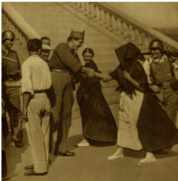
Image nº 5.- Uribarry saludant a civils al desembarcar en Eivissa.

El dia 7 d'agost, fon ocupada l'illa de Formentera. I el dia 8 estaven preparats per a ocupar Eivissa. Pero, una vegada davant dels plans d'invasió, surgiren discrepàncies en el capità Bayo per l'ordre de comandament i per la tàctica i accions a realisar. Davant d'allò Uribarry decidí ocupar Eivissa, per tal de capturar les armes, principalment ametralladores, que estaven almagacenades en el Castell, i reinstaurar les autoritats republicanes. Notícia que es donà en diverses publicacions, inclús gràfiques, com en el ABC de Madrid, del 13 agost de 1936.