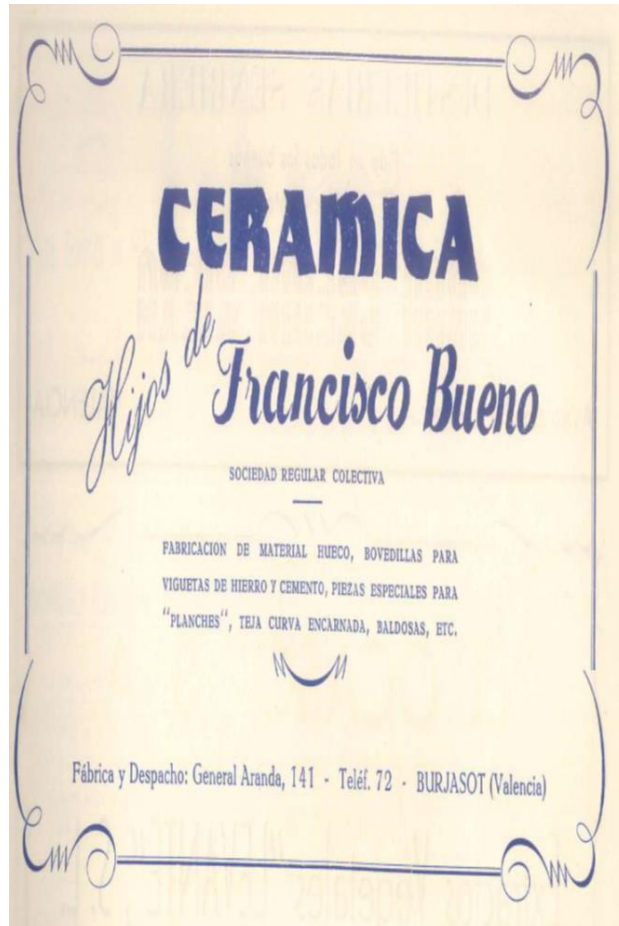
Fotografia 8). Descripció: Anunci de “Cerámica Hijos de Francisco Bueno S.R.C.” publicat entre les fulles comercials del programa de festes de “Bodas de Planta de la Coronación de la Virgen de la Cabeza”. Burjassot, setembre 1952.

Al cap dels anys, este lloc que acabaria donant nom al barri de “Cantereria”, anà variant el paisage. I, actualment és, on més o manco, es situa la parròquia i el centre educatiu de la Nativitat de nostra Senyora. 13