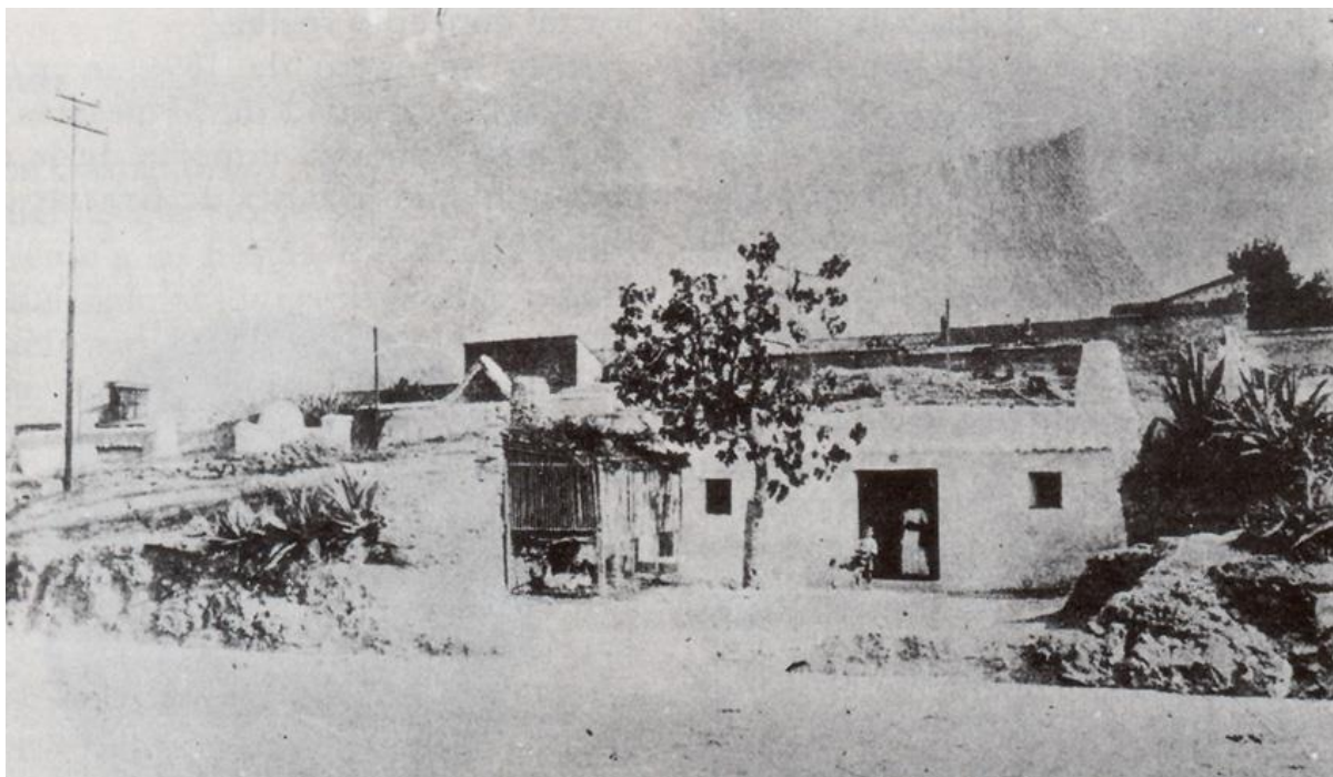
Foto 4). Descripció: Aspecte del mateix grup de coves habitades en Burjassot -possiblement junt al camí a Lliria-. Publicada en el llibre " Topografía médica de Burjasot " pel Dr. Arturo Cervellera Castro. Any 1921. V.G.G.

Atra zona que es convertí en una barriada de coves era la del terreny en costera junt a la carretera o camí a Lliria, ubicada on també estigué ubicada "la Pedrera" adés citada (que abastia també l'antic obrador de fer rajoles i teules regentat pel Sr. Llopis, al que es tenia accés pel carrer General Prim, i a poca distància d'on es construiria anys després el "trinquet"),