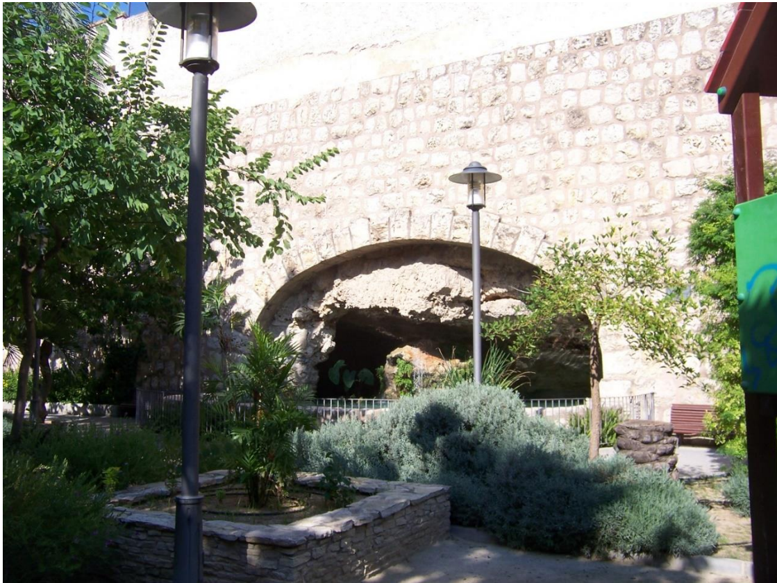
Foto 2). Descripció: Aspecte actual de la cova -recondicionada com a font ornamental- preexistent en l'interior de l'antiga pedrera seccionada, que ara dona al jardí rehabilitat, denominat actualment Parc Missioner Vicente Ferrer, ubicada junt "al Tall".

Godella, la seua explotació industrial fon tan intensa que va desaparèixer per complet (ara n'hi ha en el seu solar uns grups de vivendes i cases tipo urbanisació on abans encara estaven els restes de la pedrera i el chalet de la finca nomenada Tibidabo ). No sé si algú encara s'enrecordarà d'aquell singular chalet en eixe costat de Godella que tenia el nom de Tibidabo (inspirat -perque estava molt de moda- en aquell mont on es construïren residències i un parc d'atraccions molt famós prop de Barcelona a principi del segle XX).