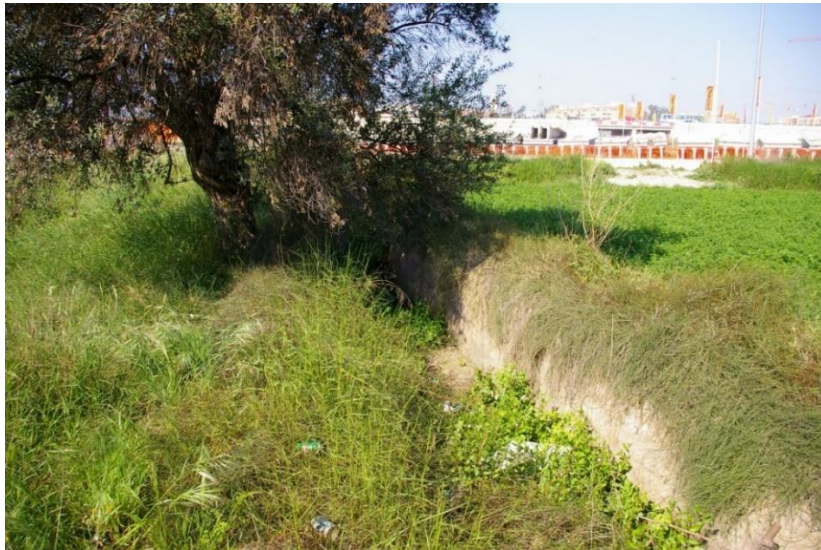
Foto nº 6. Descripció: Panoràmica del tram de la séquia de "Fartamal" (Faytanar) proper al lloc on estava el "Clot de Péntols". (Els edificis del fons són del centre comercial "Parque Ademuz" en obres).