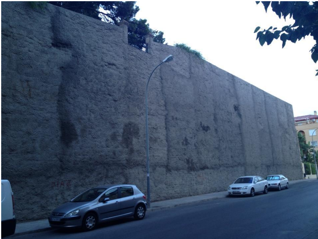
Foto nº 1.- Descripció: Aspecte actual del que es denominava (popularment) "el Tall"; lloc creuat per l'actual carrer En Joan d'Austria. El seu aspecte de cingle (en castellà farallón, precipicio, o en aragonés, cinglo), provocat artificialment, es deu al tall d'extracció de l'antiga pedrera colindant de Godella.