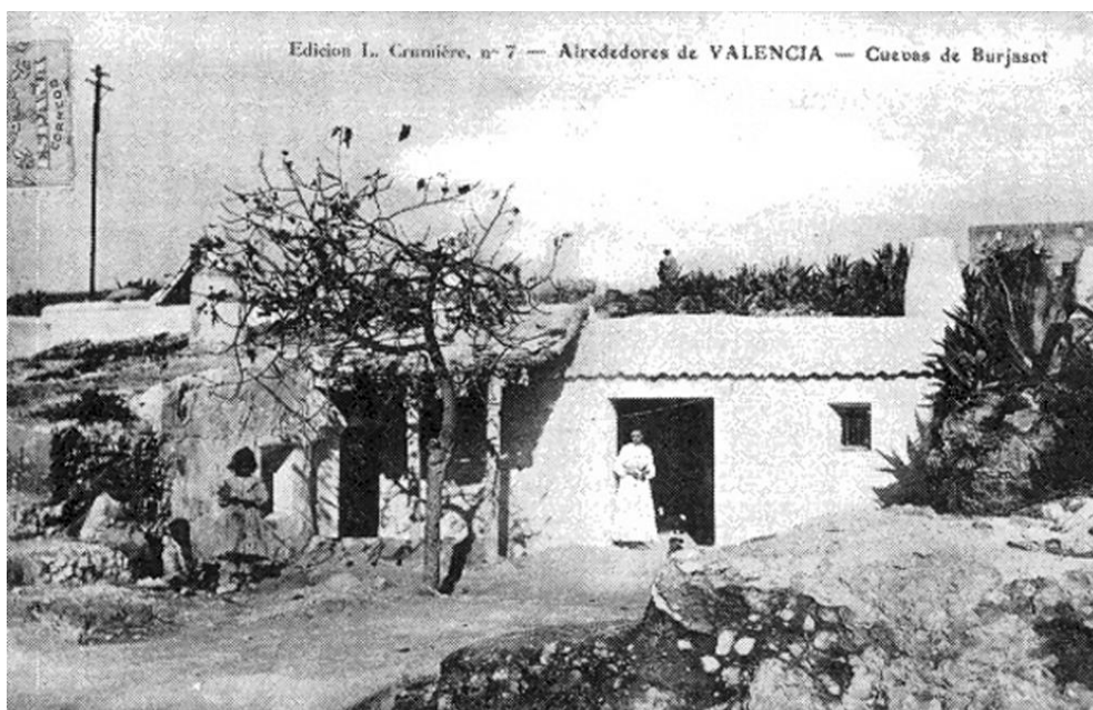
Foto 3). Descripció: Aspecte d'un nucli de coves habitades, publicada per Edicions J. Crumiere, en una targeta postal de principis del segle XX.

Una cridanera realitat posterior que cal senyalar és que, varies d'estes zones ocupades per antigues pedreres i coves d'arena, acabaren sent utilitzades per persones que immigraven sense recursos econòmics, i que patint l'escassea de vivenda, procuraren acondicionar-les artificialment com coves habitades a finals del segle XIX en diversos llocs, inclús alguna a la vora de la carretera de Lliria i de Bétera. Poc temps després, n'hi havien tantes que cridaven l'atenció de les revistes i periòdics de l'època, aixina com dels fotògrafs professionals; editant-se targetes postals com esta que ací adjunte.