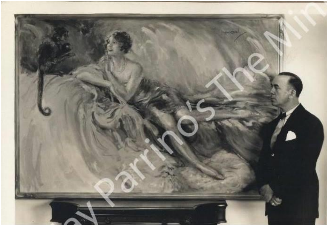
También lo vemos aquí pintando a la actriz Olive Borden.