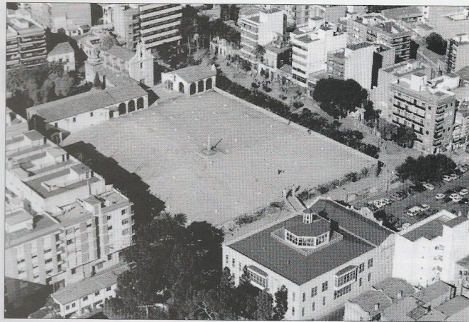
La calle del Beato estaba situada a espaldas de la Ermita

Hoy en día es una calle completamente consolidada compuesta por ocho manzanas de casas, y conformada del número 1 al 101 por