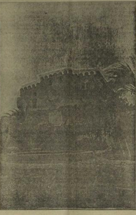
BURJASOT.—Jardín del Colegio del Patriarca, Institución Alvarez

El Colegio Mayor del Beato Juan de Ribera tiene sus reales en un soberbio castillo de alegre construcción mandado, con un bello punto a él unido, más soberbio, más alegre que el castillo.