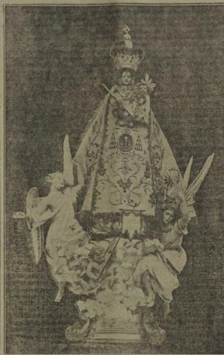
Nuestra Señora de la Cabeza Patrona de Burjasot

El movimiento parroquial de los tres años últimos corresponde, y con creces, al censo eclesialístico que hemos apuntado.