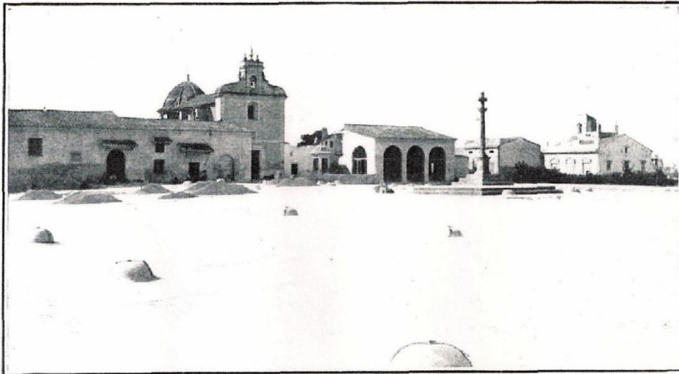
Vista general de los Silos de Burjasot

Es antiquísima la precaución de conservar el grano en lugares convenientemente acondicionados para resistir sin detrimento la influencia del tiempo.