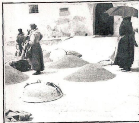
Detalle de los silos