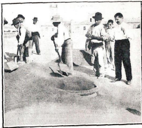
La operación de ensilar

La explanada donde se hallan las cuarenta y una bocas de los silos, tiene una dimensión de cincuenta y cinco metros cuadrados, pavimentada de piedra azulina con ligero declive para las lluvias, rodeada de muro de sostén y coronada de pretil. Me-