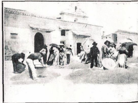
Los ensilladores limpiando el trigo