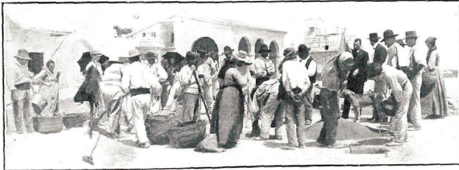
Pago del trigo tomado en préstamo al Ayuntamiento para la siembra

los cereales de manera que puedan sacarse con facilidad á medida que van necesitándose para la agricultura ó para el comercio.