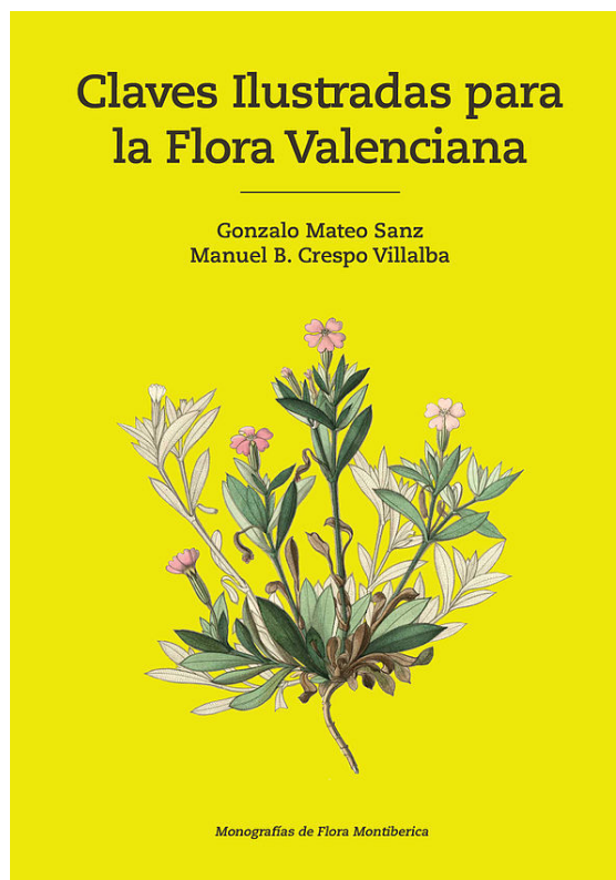
Claves Ilustradas para la Flora Valenciana