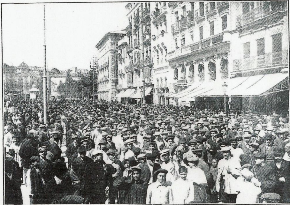
La manifestación cívica celebrada por los elementos liberales, á su paso por las calles de Valencia

Los liberales de Valencia han celebrado con gran entusiasmo una manifestación que siempre organizaban y que hace dos años no podían realizar por prohibirlo órdenes gubernativas que ahora no existen: una romería á Burjasot, al lugar en donde el cabecilla carlista Cabrera fusiló á los enemigos de su causa.