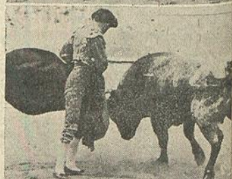
PABLITO LALANDA «El Magnífico» en dos momentos de su arte imponderable; dos momentos que revelan el arte y la exquisitez de un torero que por meritos propios debiera figurar en el grupo de los ases.

mayores de lo que sus condiciones le permiten.