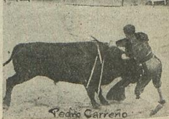
PEDRO CARREÑO en dos momentos de la lidia, reveladores de lo que es un torero. Sobre todo en la instantánea segunda se advierte al matador de corazón y estilo que sabe imprimir a la suerte de matar un sello de honradez y estilo muy estimables.