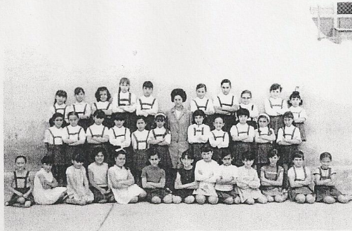
Curso 3º Año 1968-69.

En la época posterior a los años 1940 (la penosa postguerra) el Ayuntamiento era consciente del aumento considerable de población escolar (a causa de la inmigración desde otras zonas de España) por lo que se propuso dotar al municipio con dos nuevos Grupos Escolares, de conformidad con el entonces Ministerio de Educación Nacional: uno a ubicar en la entonces denominada calle Alemania (actualmente Llibertat) y otro en la calle José M a . Carrau