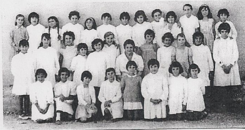
Alumnas de los primeros años.

Por ello, para comprender las circunstancias que afectaron a su construcción, debemos centrarnos en los hechos reflejados en la documentación, así como en la memoria de las personas que fueron testigos de aquellos acontecimientos.