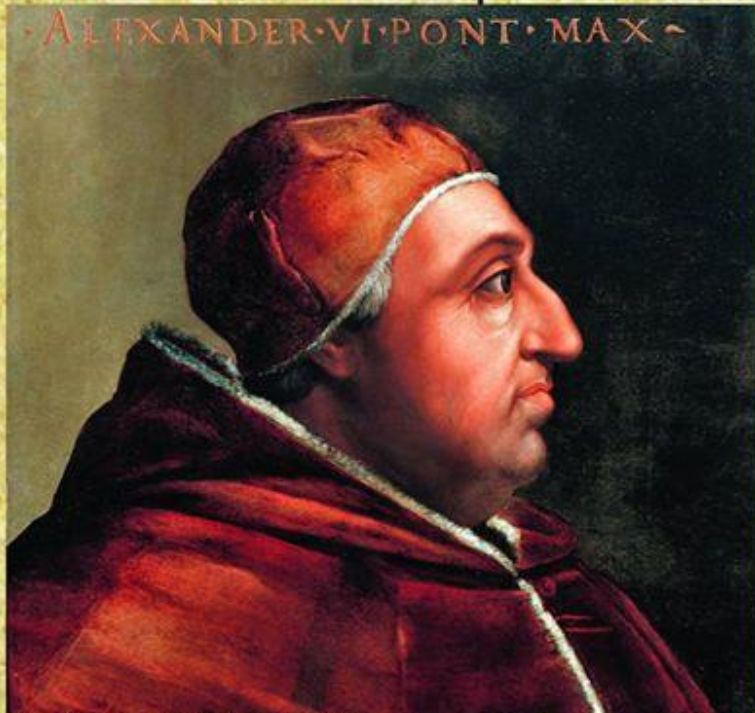
Papa Borja, de Cristofano dell'Altissimo

[1492-1503] Asi mismo son infinitas las especies de los higos y sus nombres. Tenemos higos flor, o brevas, unas negras y otras verdes. Higos ordinarios, parajales, verdales y los famosos, llamados de Burjaçote, por un lugar deste nombre que está en la huerta de Valencia, de donde tuvieron principio, según algunos. Hay de blācos y negros. En Roma los llaman Fici Borjoti, porque fue el Papa Borja Alexandro sexto, el que como Valéciano, y q̄ los conocia, procurò de trasplantarlos a Roma: y los romanos les dieron por esto el nōbre de Borjoti: o por ventura se le dieron Burjasoti, por el lugar de dōde se truxerō, y despues corrōpieron el vocablo con la semejança q̄ tiene con el nōbre del Papa.