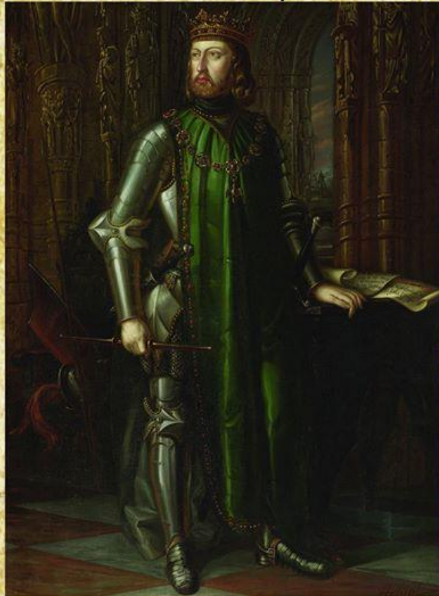
Joan I. Vicente Arbiol y Rodriguez. 1848

[1390] El rei Joan I, des de Saragossa, sol·licita de Mallorca la tramesa de set "esqueixs de figuera de Bugicot" per a plantar-los "en lo verger de la Aljaffaria".